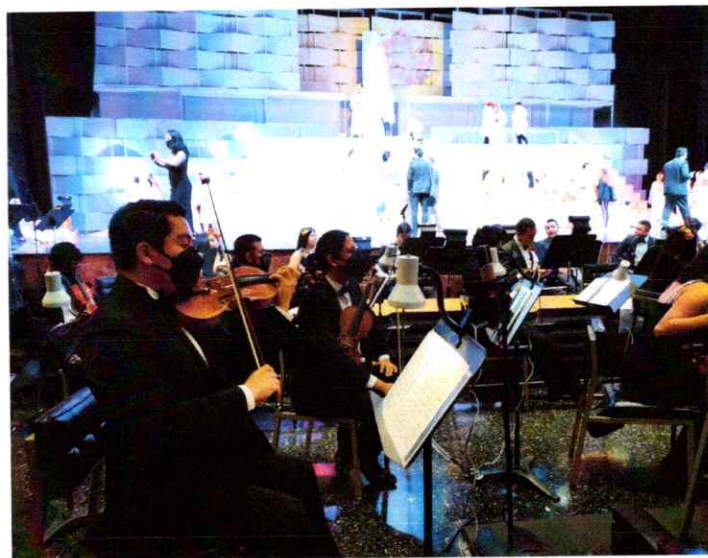
Durante el tiempo de afinación de los instrumentos de la orquesta Filarmónica Libertad

Se realizó la sexta presentación para todo público en la Gran Sala del Centro Cultural Miguel Ángel Asturias, participando el ballet, coro, solistas y orquesta Filarmónica Libertad.