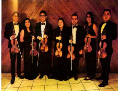
Sección de violines primeros previo a iniciar la Ópera El Pueblo K'iché

Se realizó la novena presentación para todo público en la Gran Sala del Centro Cultural Miguel Ángel Asturias, participando el ballet, coro, solistas y orquesta Filarmónica Libertad.