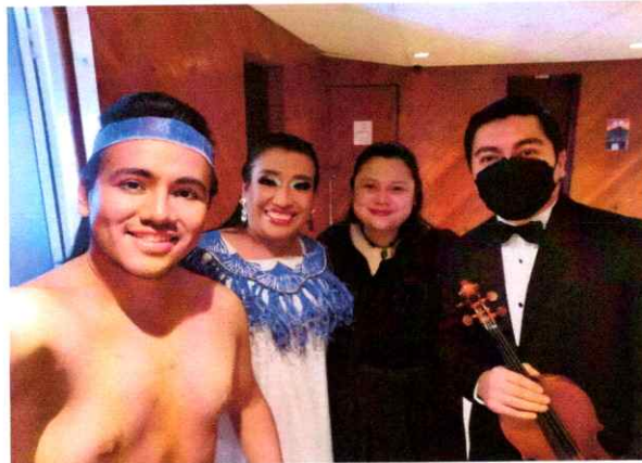
Solistas Amalchí y Alitza previo a dar inicio a la Ópera El Pueblo K'iché

Se realizó la quinta presentación para todo público en la Gran Sala del Centro Cultural Miguel Ángel Asturias, participando el ballet, coro, solistas y orquesta Filarmónica Libertad.