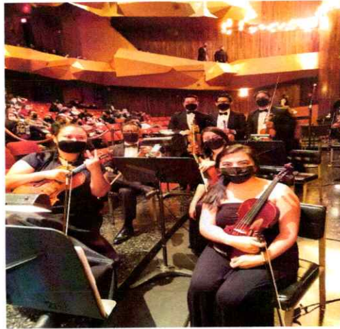
Sección de primeros violines previo a comenzar la Ópera El Pueblo K'iché

Se realizó la primera presentación para todo público en la Gran Sala del Centro Cultural Miguel Ángel Asturias, participando el ballet, coro, solistas y orquesta Filarmónica Libertad.