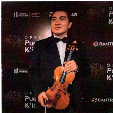
En el lobby del Teatro Miguel Ángel Asturias, previo a iniciar la Ópera El Pueblo K'iché

Se realizó la décima presentación para todo público en la Gran Sala del Centro Cultural Miguel Ángel Asturias, participando el ballet, coro, solistas y orquesta Filarmónica Libertad.